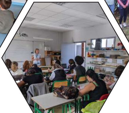
Des cours encadrés par des professionnels