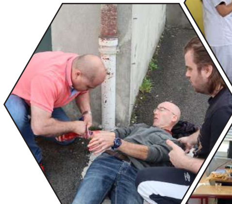
AFGSU niveau 2