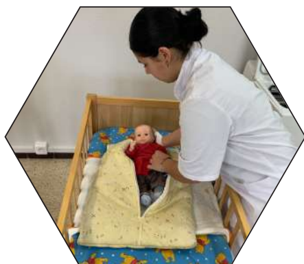
Soin à l'enfant