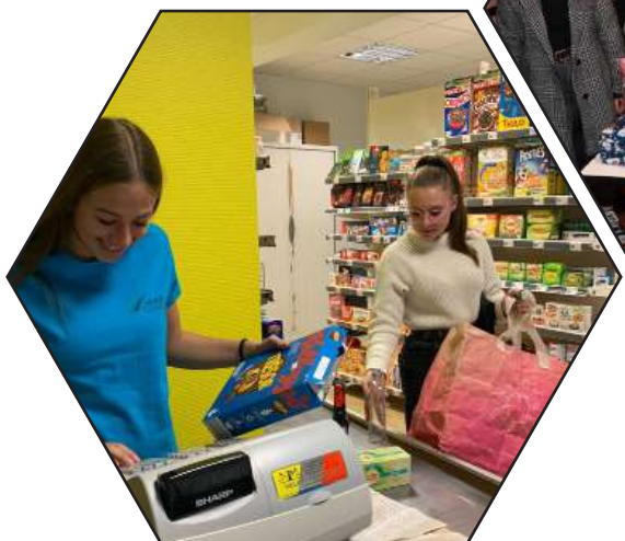
Vente en magasin pédagogique