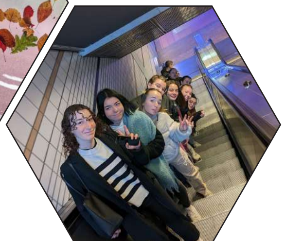
Voyage scolaire à Toulouse