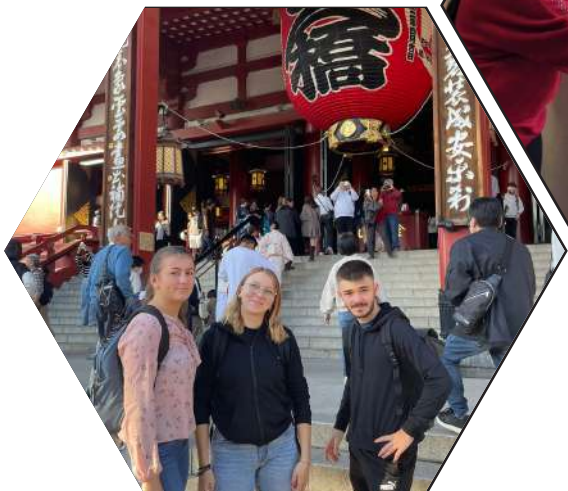
ERASMUS : Séjour au JAPON