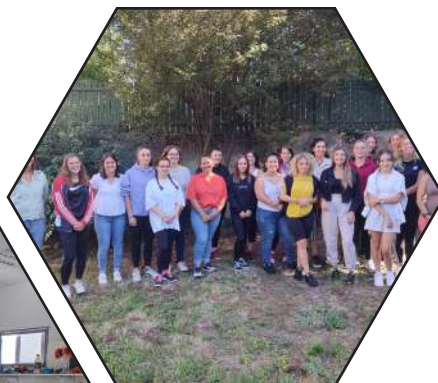
Des journées découvertes