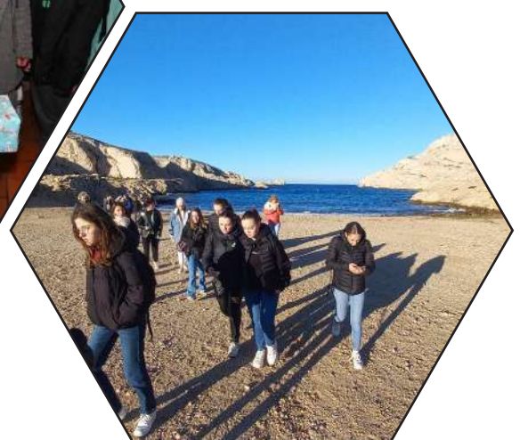
Voyage scolaire à Marseille