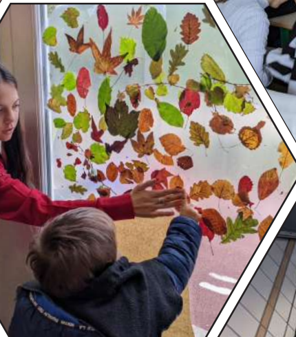
Activité avec les jeunes enfants