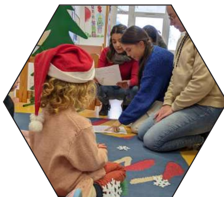
Animation auprès des enfants