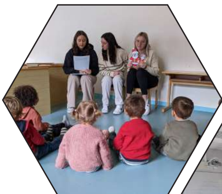
Animation avec les enfants