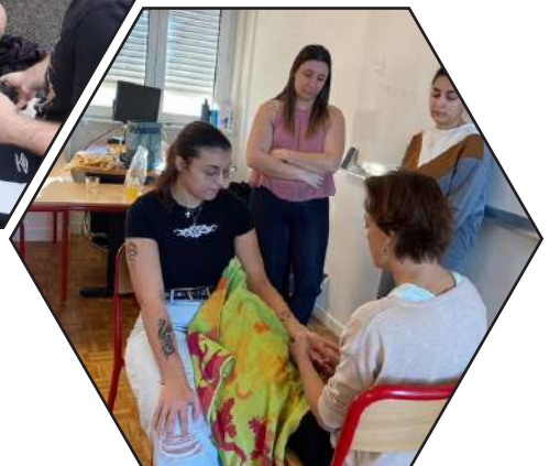
Cours de massage/bien être