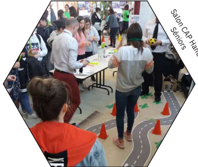
Salon CAP Handi Séniors