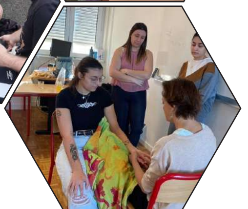
Cours de massage/bien être