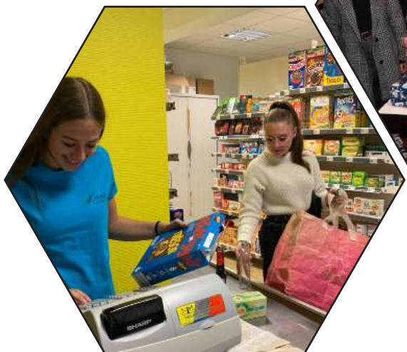
Vente en magasin pédagogique