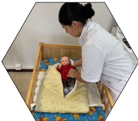
Soin à l'enfant