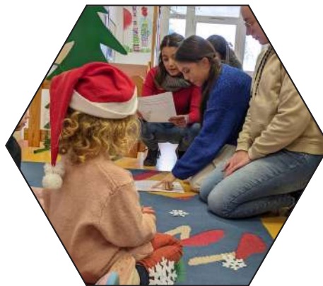
Animation auprès des enfants