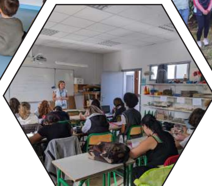
Des cours encadrés par des professionnels