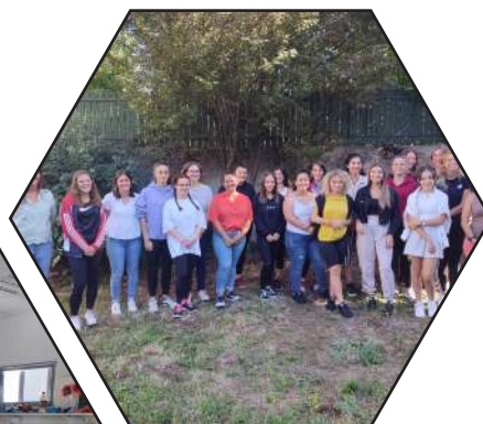
Des journées découvertes